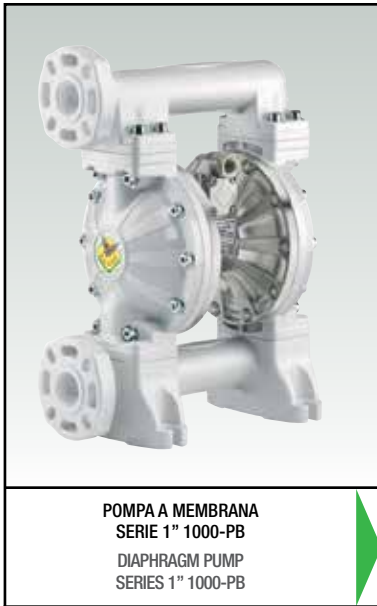
POMPA A MEMBRANA SERIE 1" 1000-PB DIAPHRAGM PUMP SERIES 1" 1000-PB