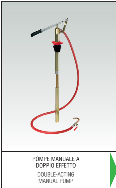
POMPE MANUALE A DOPPIO EFFETTO DOUBLE-ACTING MANUAL PUMP