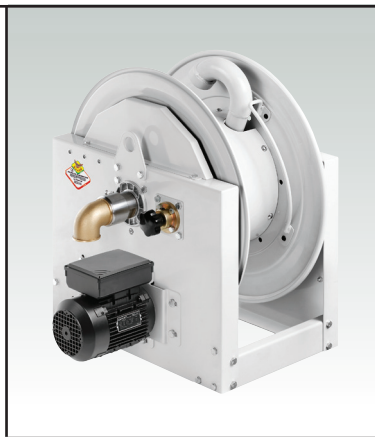
AVVOLGITUBO S.700 ELETTRICO 230V

The S.700 electric 230V hose reels to be over available in 4 different widths (see note below) may fit different hose guide 6 ports by type and location of assembly (see specific spare parts jets hose guide)